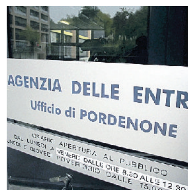
UFFICI L'ingresso dell'Agenzia delle entrate di Pordenone